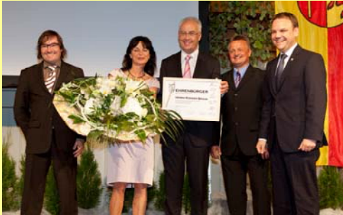
Verabschiedung von Bürgermeister Rüdiger Braun