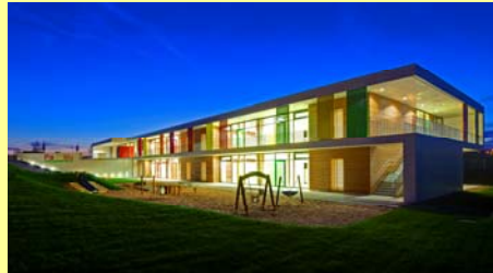
Eröffnung einer neuen Kindertageseinrichtung für unter 3- Jährige in Kooperation mit der Firma Bosch