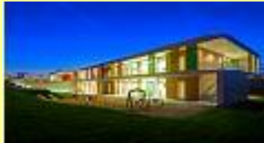
Ouverture d'une crèche pour enfants de moins de 3 ans en coopération avec la Sté Bosch